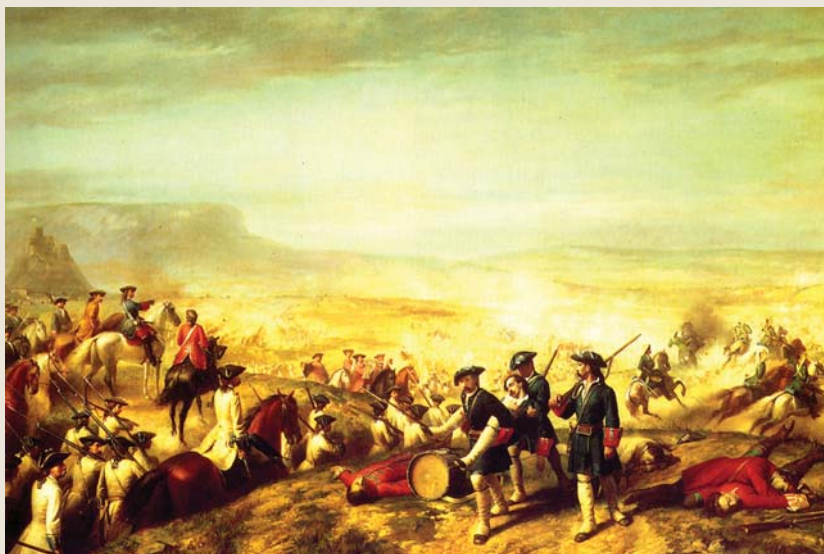
Pintura de gènere històric de Ricardo Balaca, en la qual es representa la batalla d'Almansa, esdevinguda el 25 d'abril de 1707 (Palau del Congrés, Madrid)