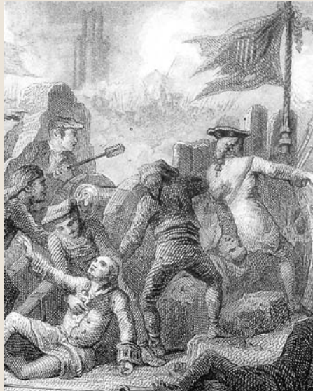
Detall d'un gravat de l'Onze de Setembre, s. XIX

Així, doncs, enfront de l'Habsburg de sempre, els regnes de la Corona catalanoaragonesa es troben davant d'una conjuntura en la qual l'opció internacional aliada els podia garantir tant una debilitació borbònica com un nou Habsburg condicionat per una successió discutida.