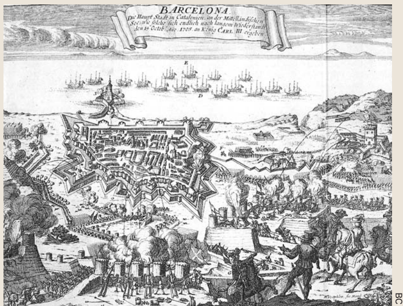
Vista de la ciutat de Barcelona durant el setge aliat de l'any 1705, en un gravat de procedència austríaca

Segons Borrás, qui va fer més per l'Arxiduc fou el mateix Felip, amb la prorrogació de les Corts, la promoció de magistratures d'origen castellà i d'assentistes francesos i l'aquarterament de tropes. Totes elles coses intolerables per «un reino acostumbrado a sus fueros y desacostumbrado a las licencias militares». 33 En aquest marc apareix l'actuació del comte de Cifuentes. Pel que sembla, la noblesa partidària de l'Arxiduc