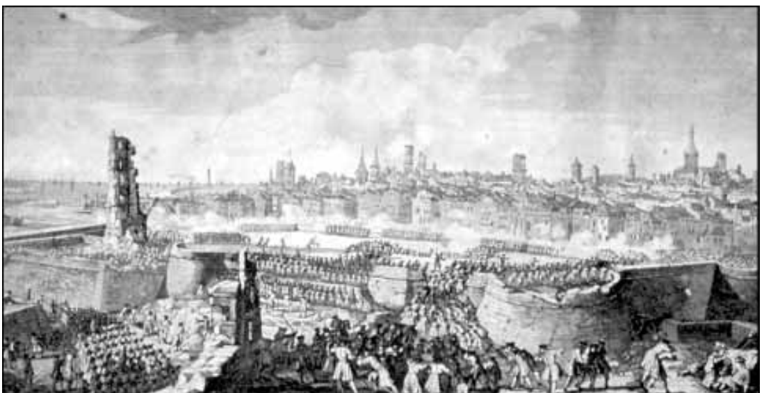
MUSEU D'HISTÒRIA DE LA CIUTAT

El vicario general don José Rifós [...] admiró la conversión del pueblo cesando todo género de diversiones, aún las más indiferentes y caseras. Mirábanse como atónitos los unos a los otros pero veíanse en sus semblantes señas de edificación y valor. Se duplicaron las procesiones de rogativas y penitencia con tanto fervor y edificación que enternecían los corazones más empedernidos, muchos con públicas penitencias en las procesiones, con tanta austeridad que fue precisa la autoridad del vicario general para imponer orden en la moderación que debían observar. [...] Concurrían sin distinción los niños y niñas vestidos de blanco. A pie descalzo y suelto el cabello, con