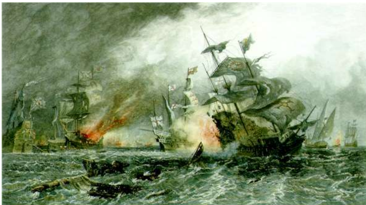
Estampa colorejada per D. Law, basada en O.W.Brierly (Londres, 1882), que reproduïx l'atac dels brulots anglesos contra part de la Armada Invencible a Gravelines, el 8 d'agost de 1588.

d'aquestes una de llurs naus a la qual havien calat foc i que estava convertida en una gran foguera" [3].