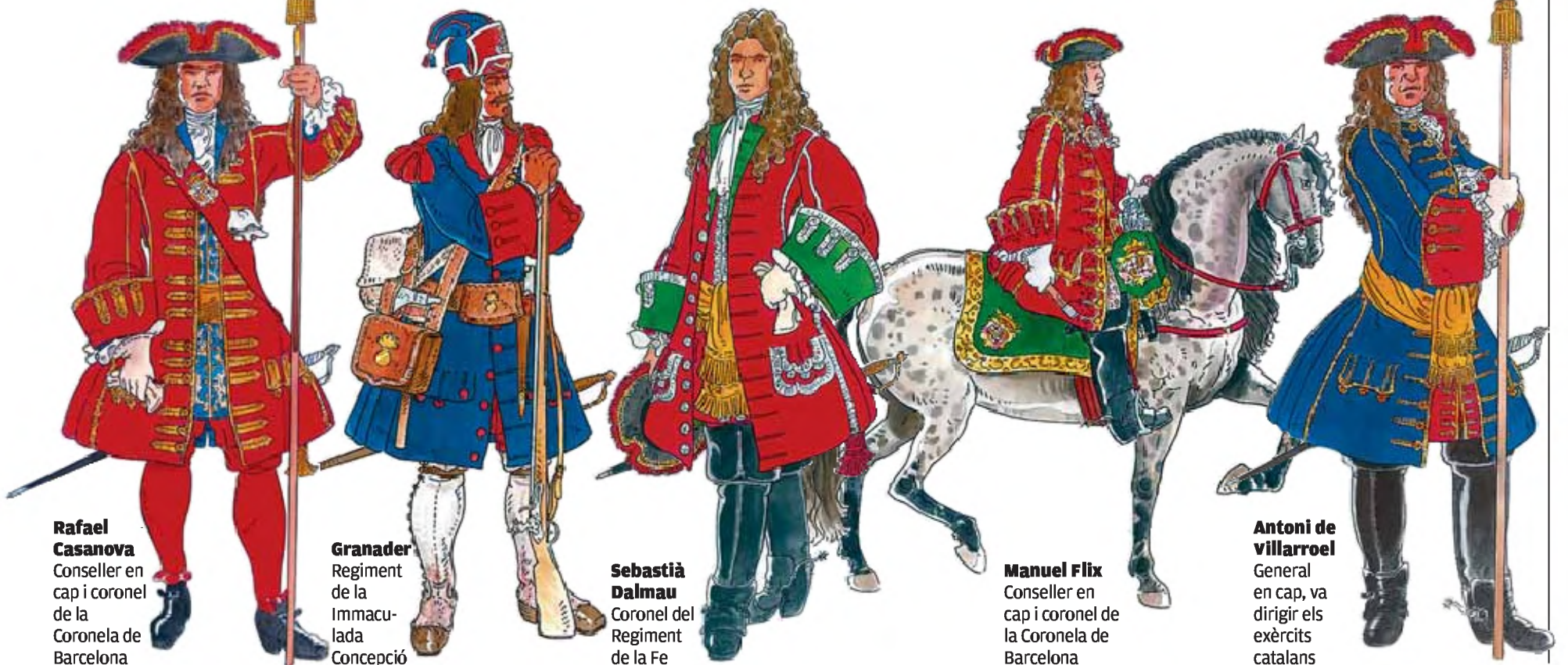
Rafael Casanova Conseller en cap i coronel de la Coronela de Barcelona