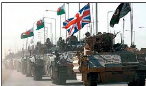
Carros britànics marxen de la base de Bàssora